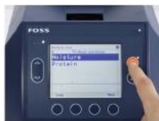
3. Нажать кнопку запуска