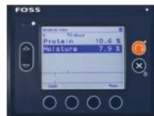
4. Результаты появляются в считанные минуты на дисплее