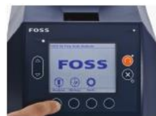
2. Выбрать тип зерна