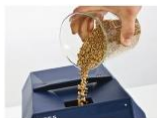
1. Засыпать образец